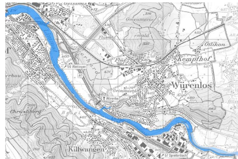
Oben: Limmat vom Kraftwerk Wettingen bis zum Kraftwerk Schiffmühle. Unten: Limmat ab Kantonsgrenze AG/ZH bis zum Kraftwerk Wettingen. (Karten aus AGIS, www.ag.ch)